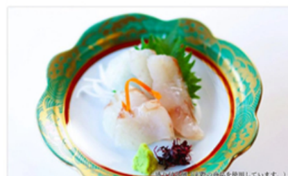
佐渡沖産ひらめのおさしみ (5切入パック×4)

鮮魚提供飲食店様におすすめ！ 店長のおすすめとして、刺身盛り一品としていかがですか？ パックから皿に盛り付けて数分経過後に提供できます。