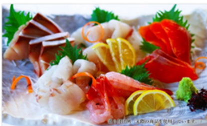
日本海のおさしみ直送便 (3カ月定期購入プラン)

市場仕入れ担当の日利きが厳選した佐渡沖の旬のおさしみ直送便。 初回申込み特典として「片割寅吉本醸造さしみ醤油」をプレゼント！ 偶数月の第4土曜日は家族でおさしみ。