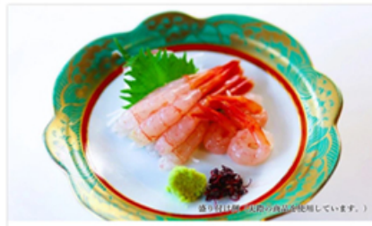
佐渡沖産南蛮えび〈甘えび〉のおさしみ (10尾入パック×4)

市場仕入れ担当の日利きが厳選した佐渡沖の旬のおさしみ直送便。 初回申込み特典として「片割寅吉本醸造さしみ醤油」をプレゼント！ 偶数月の第4土曜日は家族でおさしみ。