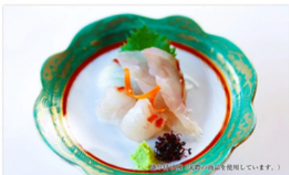
佐渡沖産真鯛のおさしみ (5切入パック×4)

鮮魚提供飲食店様におすすめ！ 店長のおすすめとして、刺身盛り一品としていかがですか？ パックから皿に盛り付けて数分経過後に提供できます。